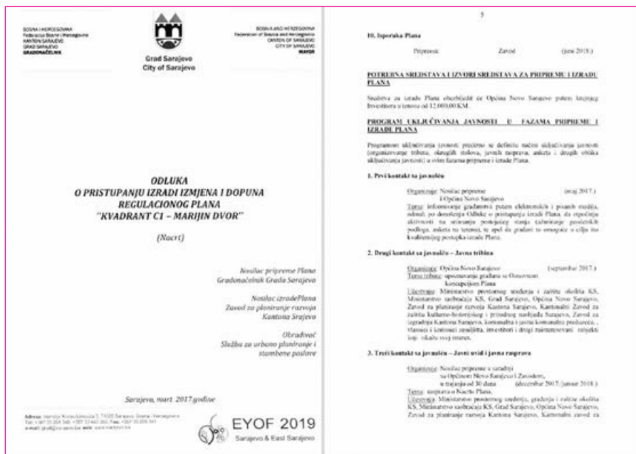
Primjer Odluke o pristupanju izradi izmjena i dopuna RP sa programom uključivanja javnosti

Pogledajmo kako se može učestvovati u procesu donošenja planskih dokumenata. Član 37. Zakona o prostornom uređenju KS-a daje osnovne smjernice za organizovanje javnog uvida i javne rasprave i definiše obaveze upravnih organa i izvršne vlasti. Organizacija javnog uvida i rasprava te preteča tehnička pitanja su obaveza i