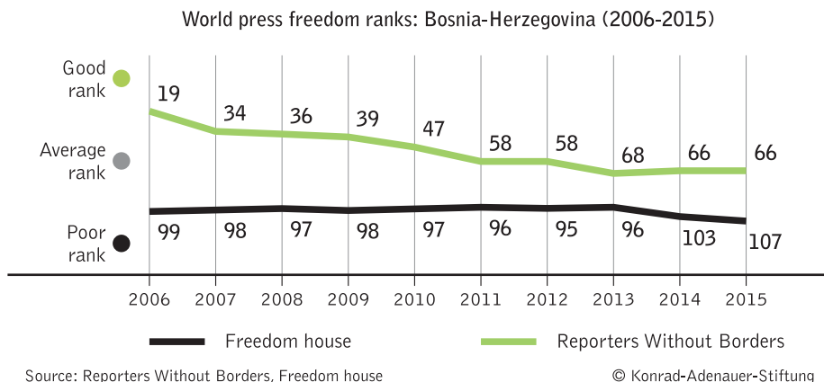
Grafikon 2: WPF Ranking za BiH 18

World Press Freedom Ranking u posljednjih deset godina bilježi povremene uspone i padove, kada je riječ o Bosni i Hercegovini (grafikon 2). Ono što se primjećuje godinama je da nema slučajeva ubistava novinara/ki, ali postoje slučajevi direktnih i indirektnih pritisaka i prijetnji.