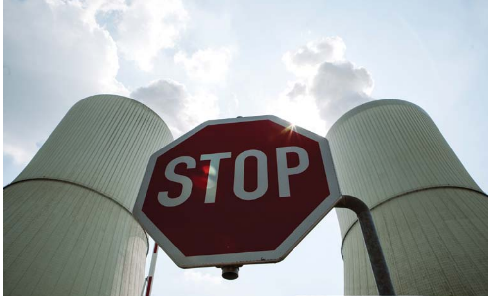
Stop ugljenu! Foto: Pay Numrich / Kohle erSetzen! (CC-BY-NC 4.0)