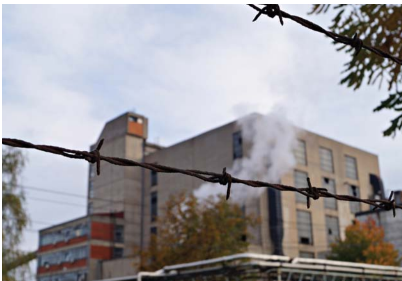
Zgrada za preradu ugljena u Vreocima, Lazarevac

Prvi korak prema ponovnom stjecanju povjerenja je pružanje tačnih i pravovremenih informacija građanima/kama Lazarevca o procesu pravedne tranzicije. Nadalje, proces treba biti transparentan i uključiv, pri čemu vlasništvo nad pravednom tranzicijom neće ostati privilegija vodećih donosioca odluka u zemlji, već će također biti u rukama onih građana/ki na koje izravno utječe tekuće i nadolazeće socioekonomske promjene. Oni/e građani/ke koji/e se