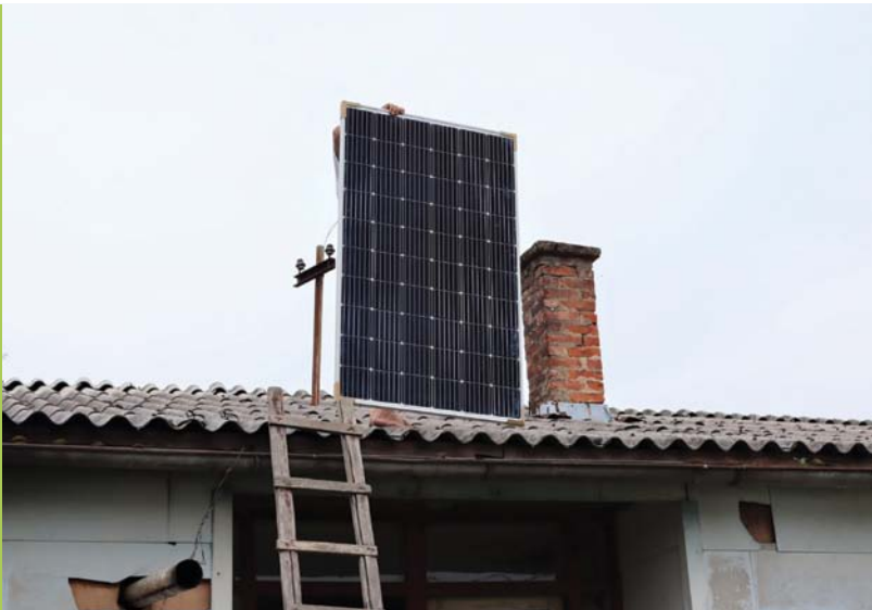
Humanitarna kampanja "Zraka sunčeve svjetlosti – svjetlo nade"

2020. godine. Zakonodavstvo u ovoj oblasti trenutno se mijenja, pa je nejasno u kojoj će mjeri ovakvi poticaji postojati u budućnosti.