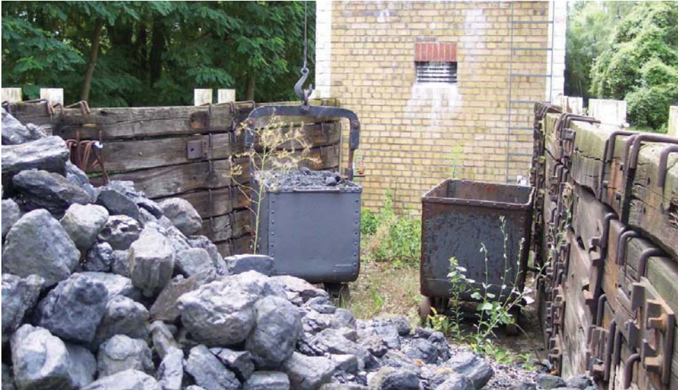
Kolica za uglj