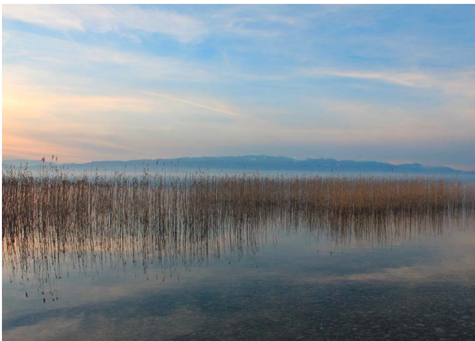
Ohridsko jezero, Sjeverna Makedonija

Dakle, populizam i njegove inicijative su otporna društvena pojava usmjerena na suzbijanje zbijenog sastava vladajućih elemenata. Ujedno djeluju i odgajaju maštu i volju u izravnom političkom djelovanju kroz filtere različitih političkih odnosa i tropa. Time se razvodnjani i otuđeni suverenitet vraća tamo odakle je iscurio i razvodnjen,