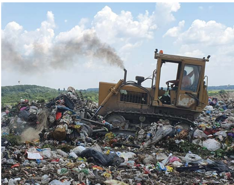
Odlagalište otpada

Nismo uspeli ni da da izmerimo koliko su stanovnici Evrope zaista ekološki i društveno osvešćeni, jer je Kina zabranila uvoz otpada i rešila da ne bude više deponija Zapadnog sveta i bez njihove pomoći.