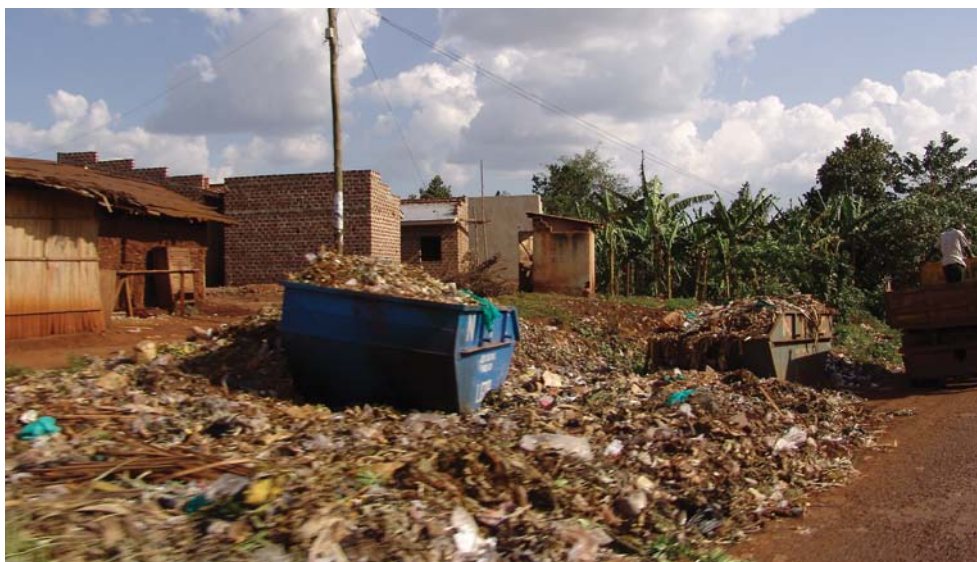
Upravljanje otpadom

Kada pogledamo podatke o izvorima zagađenja PM česticama, prednjače dva izvora: individualna ložišta na prvom mestu i proizvodnja električne i toplotne energije na drugom. Povećanje broja individualnih ložišta je direktno povezano sa padom ekonomskog standarda i energetske siromaštvom: cene centralnog grejanja ne odgovaraju ekonomskom standardu građana i često predstavljaju veliko opterećenje za kućni budžet. Za primer, uzećemo stanje u Beogradu. Većina potrošača koji su priključeni na centralno grejanje nema mogućnost da plaća grejanje prema potrošnji i plaća fiksni iznos preko cele godine. Cena za stan od 70 kvadrata je 8.357,48 dinara mesečno odnosno 100.289,70 na godišnjem nivou. Prema zvaničnim podacima u maju 2021. polovina zaposlenih je ostvarila zaradu do 49.869 dinara. Računicom dolazimo do toga da je za prosečnog zaposlenog u Srbiji centralno grejanje trošak koji iznosi barem 16,75% mesečne zarade, odnosno čak dve mesečne zarade na godišnjem nivou.