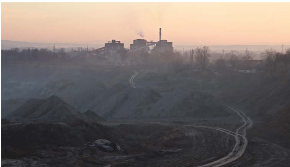
Termoelektrana Veliki Crljeni, Lazarevac