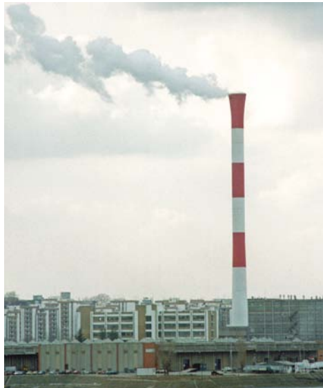
Srbija: Dorćol Beograd

Zelenu agendu uvelike podržava Ekonomski i investicijski plan za Zapadni Balkan, koji je Evropska komisija usvojila početkom 2020. godine, a koji predviđa 9 milijardi eura za projekte usmjerene na dekarbonizaciju, sektor obnovljive energije i obnovu zgrada.