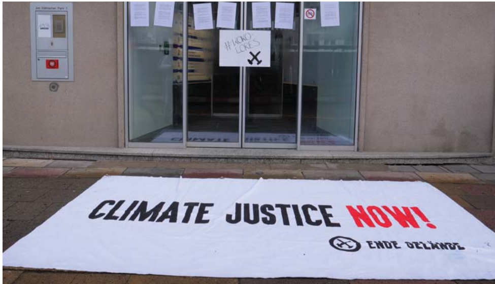
Ende Gelände Berlin posjetio je sjedište BUND-a kako bi podsjetio ljude na Pariški klimatski sporazum. Rezultati Komisije za ugljen nisu u skladu s ciljem od 1,5 °C.

zloupotrebjavaju ili upotrebljavaju pogrešno za služenje drugim interesima, pa stoga ne postoji stvarna politička moć iza zagovaranja promjena.