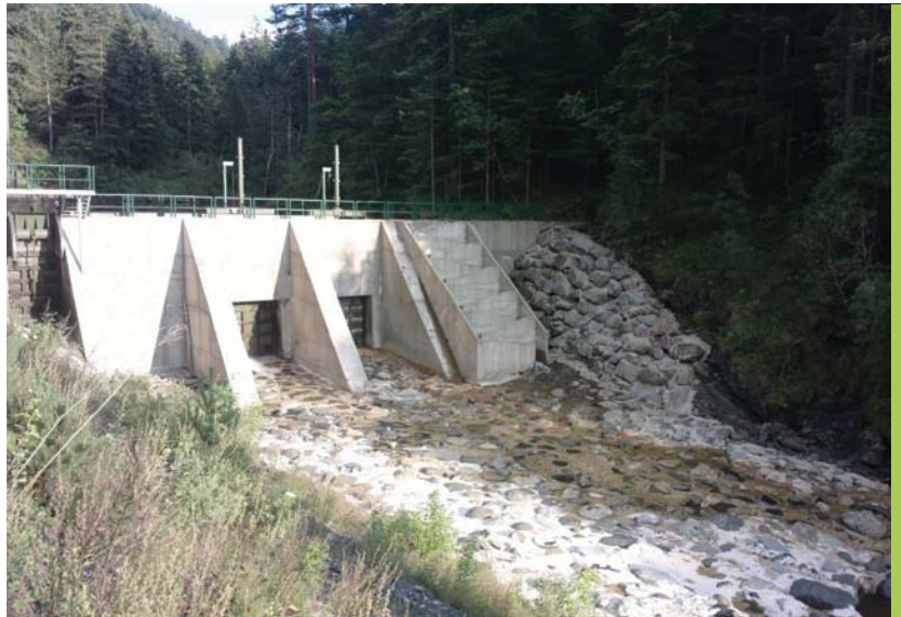
Mini-hidroelektrana uništila rijeku Gostović blizu Zavidovića

Nedavno je pokrenuto nekoliko kampanja civilnog društva protiv mikro hidroelektrana. Vlade su izdale stotine koncesija i dozvola za izgradnju takvih objekata kao oblika zelene energije, subvencioniranih javnim sredstvima, uz simbolične koncesijske naknade. Njihove dozvole propisivale su takozvani "minimalni ekološki prihvatljiv protok", ali