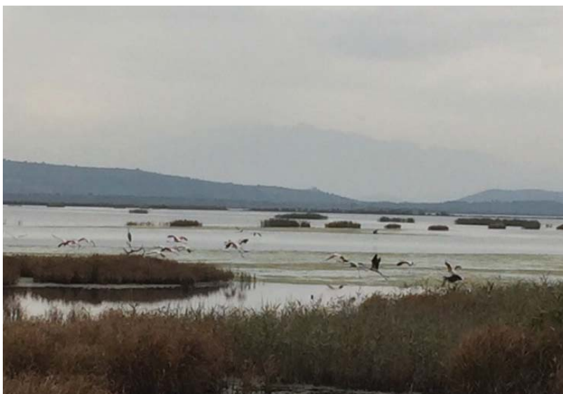
Utočište za ptice, Solana Ulcinj

Referendumom koji je održan 21. maja 2006. godine, Crna Gora je postala nezavisna država. Za izlazak iz državne zajednice sa Srbijom glasalo je 55,54 posto, a za ostanak 44,46 posto. I to je bila svojevrsna rijetkost jer je većina potrebna za odluku o odcjepljenju bila 55% od ukupnog broja glasova, a ne, kao što je uvijek slučaj, 50% plus 1. Od sticanja nezavisnosti, Crna Gora je imala veliku razvojnu priliku, s punim potencijalom za reforme i ulaganja. Međutim, kako se ove godine obilježava 15. godišnjica nezavisnosti, opći je dojam da potencijal