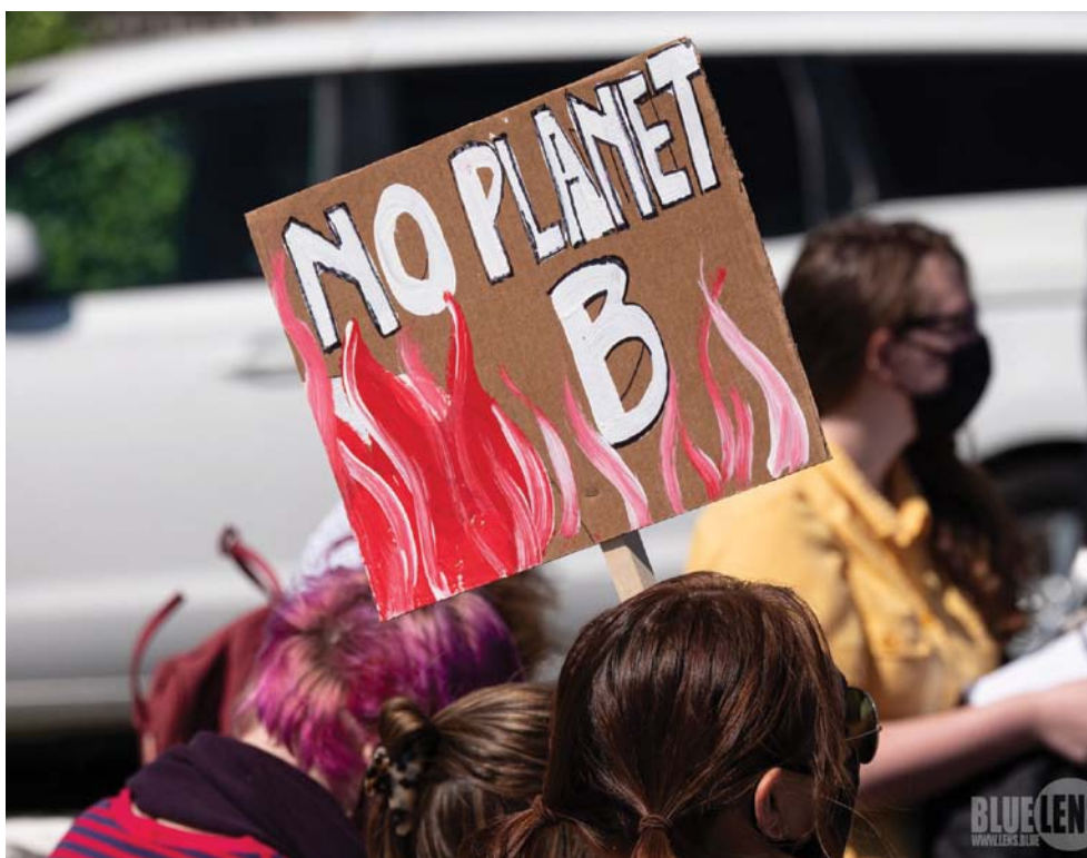
Klimatski protesti

Pitanje je zašto je otpor stanovništva na Staroj planini bio efikasniji, a potom i medijski vidljiviji. Verovatno je nedostatak dovoljno jake reakcije lokalnog stanovništva na drugim žarištima (Goč, Golija, okolina Kraljeva) razlog zašto izostaje veća reakcija medija i javnosti, uprkos povezivanju sa širim krugom ekoloških aktivista.