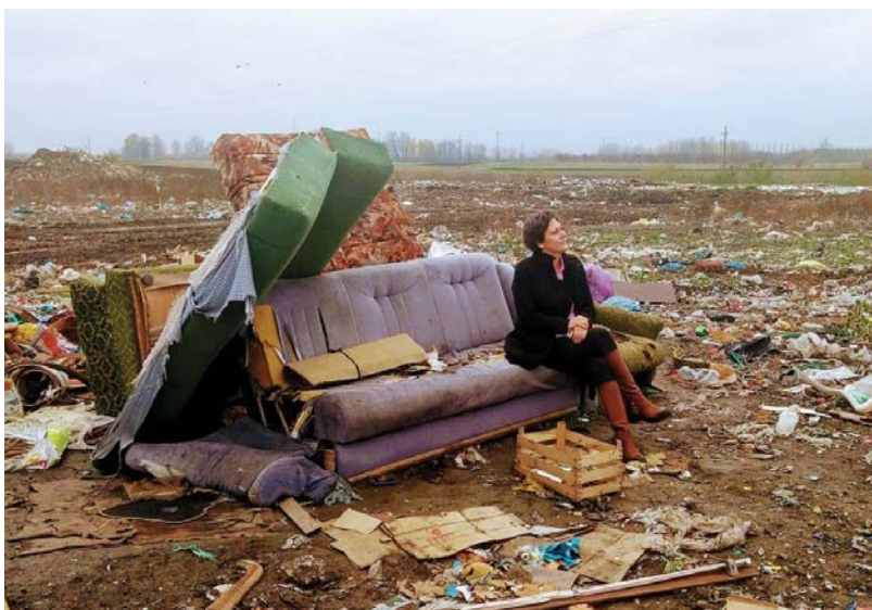
Žene kod odlagališta otpada

Pitanje monitoringa i kontrole zagađivača i uspostavljanje efikasnog sistema naplate finansijskih sredstava od kompanija "zagađivača" iz ovih razloga mora biti deo političke agende svih zelenih, levih i socio-demokratskih stranaka. Preuzimanje potpune finansijske odgovornosti za otpad ili zagađenje od strane kapitala je jedini efikasan put ka održivom razvoju u državama sa nižim